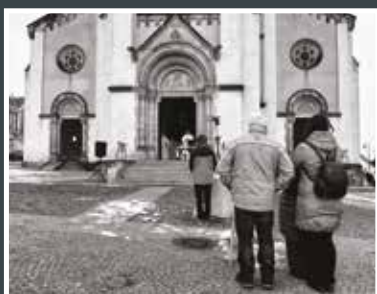
4. Miloš Kostka Venkovní mše svatá