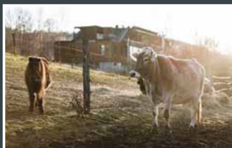
5. Kateřina Šoulová Čabárna