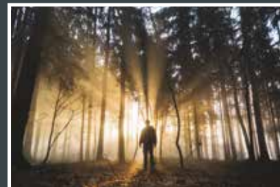
3. Jaroslav Valenta Hřejivé paprsky vycházejícího slunce...