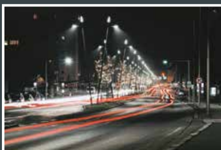
10. Petr Sedláček Probouzející se vánoční Kladno