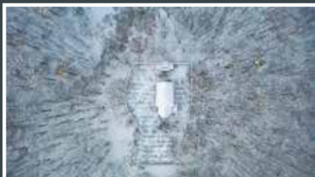
14. Tomáš Liba U Jána