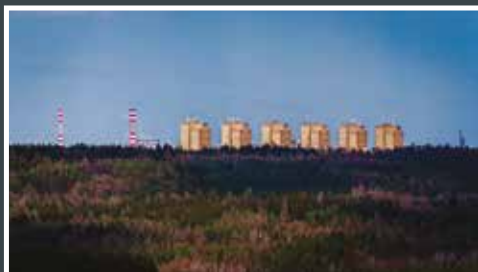
7. Petr Sedláček Pohled z Tuchlovic