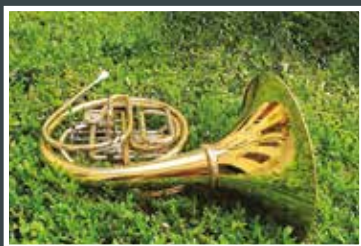
Iva Štěrbová, 57 let Kladenský zámek v rohu (lesním)