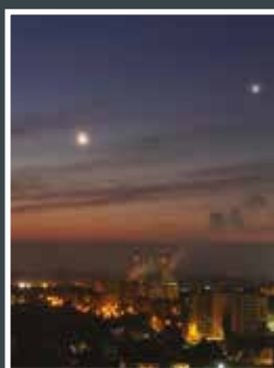
18. Diana Kessnerová Setkání Měsíce s Jupiterem ...