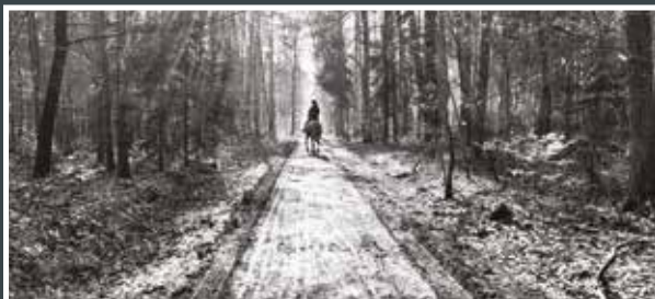
2. Vladislav Tesárek V lese kousek Na Cimmském