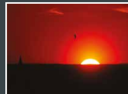
12. Radek Valeš Západ sluníčka s rorýsem