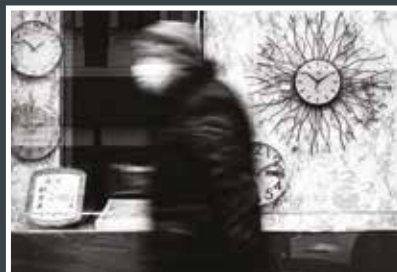
8. Miloš Kostka Kladno zastavené