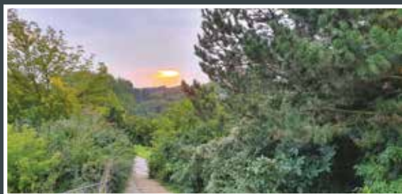
Petr Kostka, 33 let Síteňská džungle