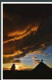
Zuzana Kúnová, 42 let Západ slunce v červenci