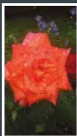
Matěj Veselý, 11 let Barvy po dešti