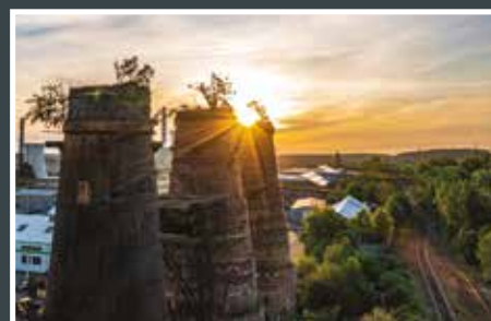
6. Tomáš Liba Zář nad vápenkami