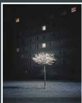
17. Iva Štěrbová První snh 2021